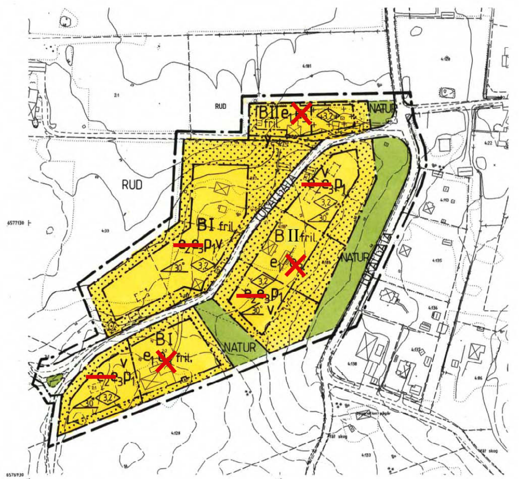
Grundkartan framtagen från Hammarö primärkartebas 1999-08-26