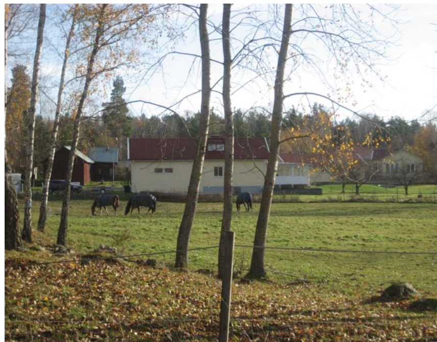
Betande hästar i Torp.

Ett hästnära boende är ett livstilsboende där de boende inom området delar ett stort hästintresse och gemensamt äger och sköter anläggningar kopplade till hästverksamheten. Det kan vara t.ex. stall, ridhus, ridstigar och hagar. En stor fördel med ett sådant boende är att mycket av den tid, kostnader och ansvar som en egen hästgård innebär försvinner, vilket ger ett mer bekvämt och enklare hästägande.