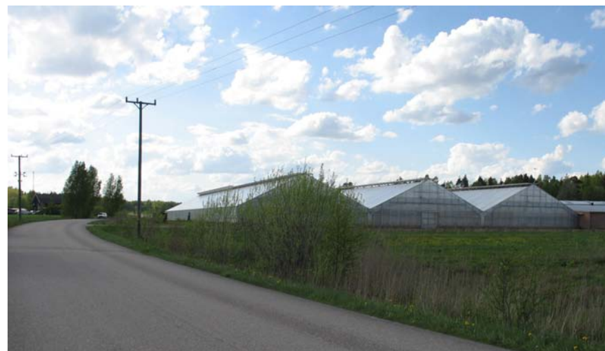
Växthuset i Torp.

åkermark och mindre skogsdungar. Området angränsar i den norra och östra delen till ett större skogsområde. I söder brukas marken för jordbruksändamål vilket gör området relativt öppet ned mot Sättersviken. I Torp finns ett rikt antal hästar och är hem för flera privata stall samt Hammarö Ryttarförenings ridskoleverksamhet. Som väldigt iögonfallande för området finns ett större växthus, där Jensens Blommor har sin verksamhet.