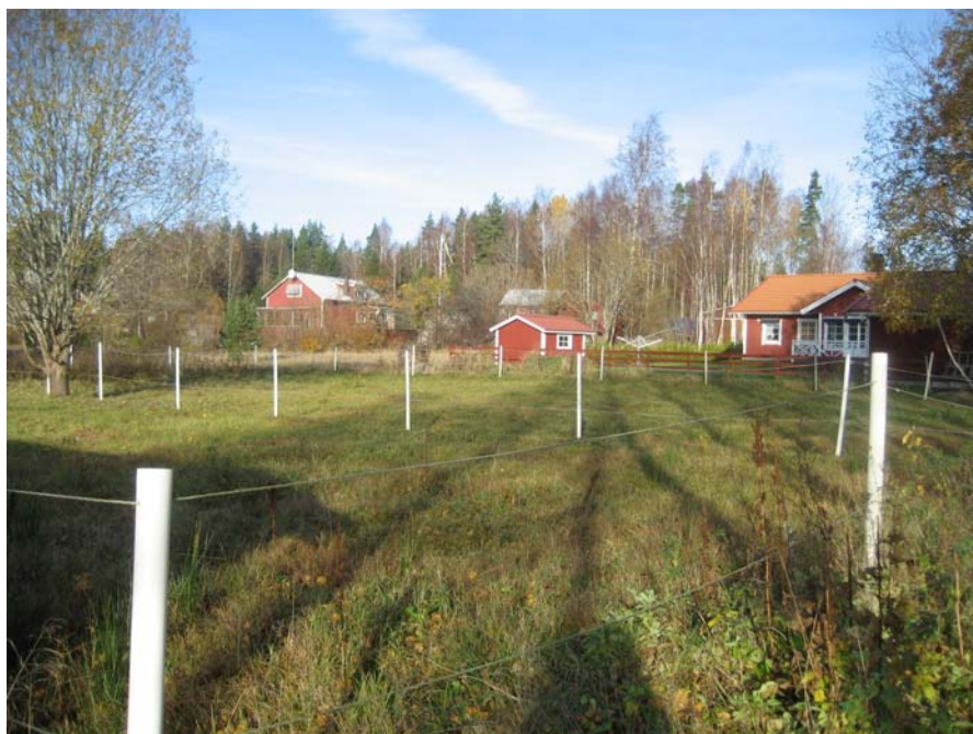
Exempel på villabesbyggelse i Torp med angränsande hästagar.

Huvudvägen genom Torp är Kilenevägen. Trafikbelastningen på denna väg är relativt hög då vägen leder till friluftsanläggningen Kilenegården som har ca 300 000 besökare per år.